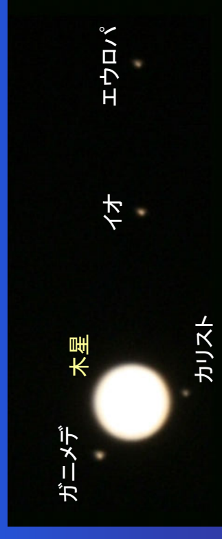
ガニメデ 木星 イオ エウロパ カリスト